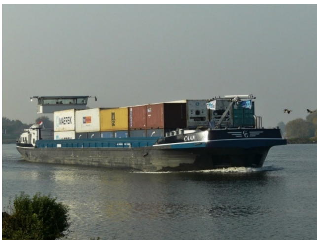
MS Caan (archieffoto).

MS Caan is een containerschip, 90 meter lang, 12 meter breed.